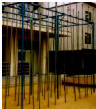
Foto del juego japonés en el patio de una escuela

La escenografía es un módulo de juego de escuela primaria en Japón. Las imágenes que emergen de niños perdidos en un bosque como en el célebre cuento de los hermanos Grimm: "Hansel y Gretel". Un combate mortal entre una bruja y un mono, como esos personajes que se encuentran en las tradicionales óperas chinas y una isla misteriosa parecida a las del novela de William Golding "Su majestad las moscas". Un tema: el coraje El coraje que hay que tener para afrontar la vida sobre nuestro planeta Tierra.