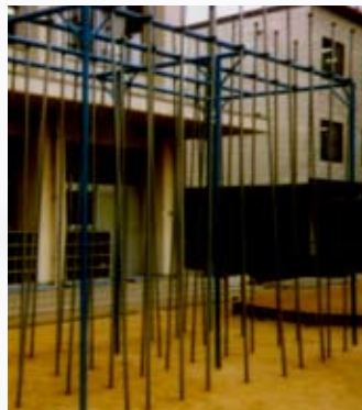
Photo du jeu japonais dans une cour d'école

Un module de jeu dans une cour d'école primaire au Japon. Des images qui émergent, des enfants perdus dans une forêt comme dans le célèbre conte des frères Grimm « Hansël et Gretel ». Un combat mortel entre une sorcière et un singe comme ceux qu'on retrouve dans les traditionnels opéras chinois. Et une île mystérieuse semblable à celle du roman de William Golding « Sa majesté des mouches ». Un thème, le courage. Le courage que ça prend pour affronter la vie sur notre planète, la Terre.